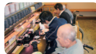
10月/ドライブ・外食支援・収穫祭